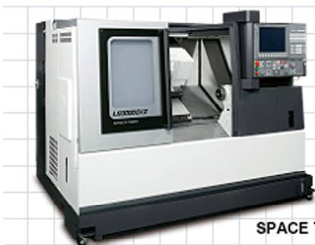
SPACE TURN LB3000 EX II